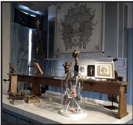
Parcours Métrange - expositions 2016

Pour l'édition 2018, le Festival Court-Métrange renouvelle sa collaboration avec le Naia Museum (Rochefort-en-terre), premier et unique musée du fantastique en France au travers d'une exposition collective, investissant les territoires de l'art imaginaire et visionnaire.