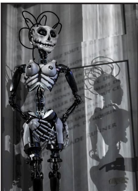
Parcours Métrange - expositions 2017